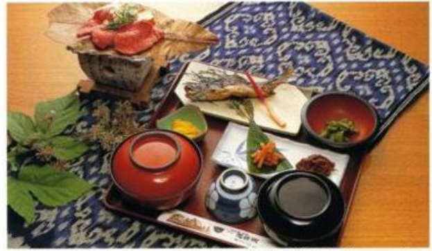
SHIRAKAWA-GO SET 白川郷定食[肉増量コース]