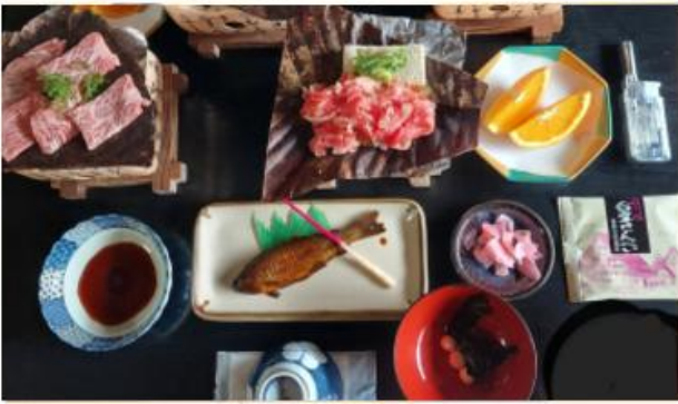
HIDA BEEF FULL MEAL SET 飛騨牛満腹御膳