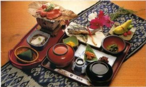
GASHO SET 合掌定食