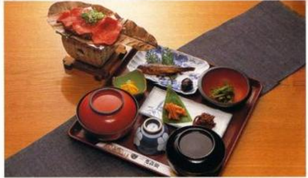
GRILED WAGYU WITH MISO SET 和牛肉味噌御膳