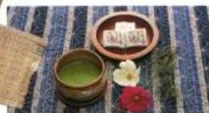
GREEN TEA 抹茶