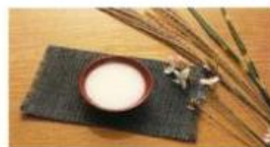
NIGORI ZAKE にごり酒